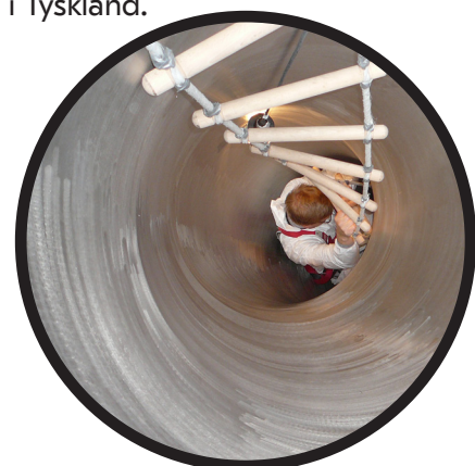
STUK:s lokala inspektör på väg för att inspektera ett rör för reaktorns primära nedkylningskrets.